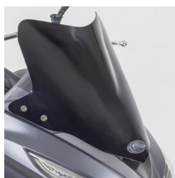
PARE BRISSE SPORT NOIR SATINE X.TOWN / DINK STREET 125 /300 KA-01-0242